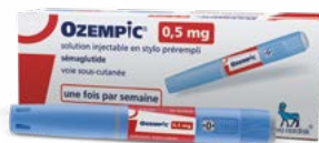
OZEMPIC® 0,5 mg