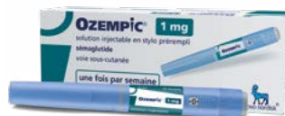
OZEMPIC® 1 mg

Si vous ressentez un quelconque effet indésirable, parlez-en à votre médecin, votre pharmacien ou à votre infirmier/ère. Ceci s'applique aussi à tout effet indésirable qui ne serait pas mentionné dans cette notice.