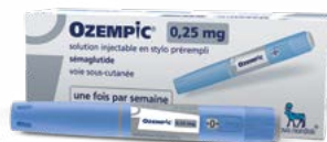
OZEMPIC® 0,25 mg

▼ Ce médicament fait l'objet d'une surveillance supplémentaire qui permettra l'identification rapide de nouvelles informations relatives à la sécurité.